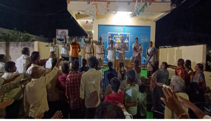
పాటించకపోవడం, హెల్మెట్, సీట్ బెల్ట్ వాడకంలో అలసత్వం వంటి కారణాలే ప్రమాదాలకు ప్రధాన పాల్గొన్నారు.

.తెలంగాణ పోలీస్ శాఖ ఆధ్వర్యంలో నిర్వహిస్తున్న "అరెస్ట్ అలైవ్" అవగాహన కార్యక్రమంలో భాగంగా జిల్లా ఎస్పీ ఆదేశాల మేరకు సిరిసిల్ల పట్టణ పరిధిలో పలు వార్డు లలో రోడ్డు భద్రతపై ప్రత్యేక అవగాహన కార్యక్రమం చేపట్టి రోడ్డు భద్రత కమిటీలు ఏర్పాటు చేశారు. ఈ సందర్భంగా ప్రజలకు ట్రాఫిక్ నియమాల ప్రాముఖ్యతను వివరించి, వాటిని కచ్చితంగా పాటించాలని, సురక్షిత ప్రయాణానికి సంబంధించిన ప్రతిజ్ఞను చేయించారు. ఈ సందర్భంగా డిఎస్పీ మాట్లాడుతూ.. రోడ్డు భద్రత, సురక్షితమైన ప్రయాణం ప్రతి ఒక్కరూ తమ బాధ్యతగా భావించినప్పుడే రోడ్డు ప్రమాదాలను సమర్థవంతంగా నియంత్రించగలమన్నారు. రోడ్డు ప్రమాదాల గణాంకాలను పరిశీలిస్తే, ఎక్కువ శాతం ప్రమాదాలు మానవ నిర్లక్ష్యం వల్లే జరుగుతున్నాయని తెలిపారు. మధ్యం సేవించి వాహనాలు నడపడం, అతివేగం, ట్రాఫిక్ నిబంధనలు