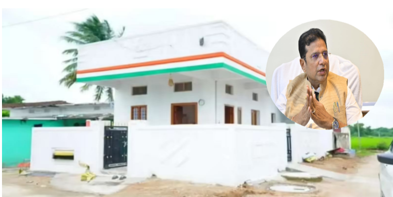
అవసరమైన మౌలిక వసతుల కల్పనపై ప్రభుత్వం ప్రత్యేక దృష్టి సారించింది. కైతాపూర్ సముదాయంలో ఇంకా మిగిలి ఉన్న గృహాల కేటాయింపులో స్థానిక పేదలకు, వికలాంగులకు, జర్మిస్తులకు ప్రాధాన్యత ఇస్తామని ఆయన హామీ ఇచ్చారు. అర్హులైన