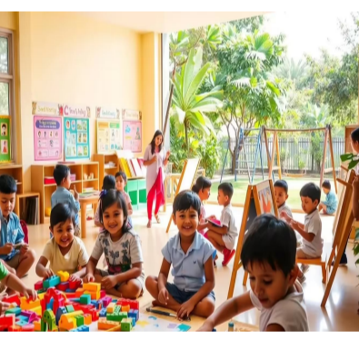
వీలుగా అన్ని జిల్లాల కలెక్టర్లు, విద్యాశాఖాధికారులు తగిన చర్యలు తీసుకోవాలని విద్యాశాఖ ఉన్నత స్థాయి అధికారులు జారీ చేసింది. ఈ విభాగాల నిర్వహణ కేవలం భవనాలకే పరిమితం కాకుండా.. అత్యంత నైపుణ్యం కలిగిన సిబ్బందితో సరవాలని ప్రభుత్వం భావిస్తోంది. ఇందుకోసం వేతన ప్రాతిపదికన ప్రీ-ప్రైమరీ ఇన్స్ట్రక్టర్లు, వినియోగ సంగ్రహణ కోసం ఆదాయాలను నియమించే బాధ్యతను జిల్లా కలెక్టర్లకు అప్పగించారు. దీనిపట్ల స్థానికంగా ఉండే అర్హులైన వారికి ఉపాధి అందించడంతో పాటు పాఠశాల పర్యవేక్షణ కూడా సమర్పవంతంగా జరుగుతుంది.

హైదరాబాద్ : తెలంగాణ ప్రభుత్వం విద్యా వ్యవస్థలో విప్లవాత్మక మార్పులకు శ్రీకారం చుట్టింది. ప్రభుత్వ పాఠశాలల్లోని ప్రీ-ప్రైమరీ సూక్ష్మకు దీటుగా నాణ్యమైన విద్యను అందించడమే లక్ష్యంగా ప్రీ-ప్రైమరీ తరగతులను ప్రారంభించాలని నిర్ణయించింది. రాష్ట్రవ్యాప్తంగా విడతల వారీగా ఈ తరగతులను విస్తరిస్తున్న ప్రభుత్వం.. ఈ విద్యా సంవత్సరం (2026-27) నుంచే కొత్తగా 2,769 ప్రభుత్వ పాఠశాలల్లో ప్రీ-ప్రైమరీ విభాగాలు ప్రారంభించేందుకు గ్రీన్ ఫీల్డ్లు కొట్టింది. ప్రైవేటు పాఠశాలలకు వెళ్లే నిర్హారులను ఆకర్షించేలా, ప్రభుత్వ పాఠశాలల్లో అన్ని అనుమతి చిన ఈ 2,769 సూక్ష్మకు రెండు ప్రధాన రీజియన్లుగా విభజించారు. ఇందులో క్యూర్ రీజియన్ పరిధిలో 529 విభాగాలు, నాన్ క్యూర్ రీజియన్ పరిధిలో 2,240 విభాగాలు ఉన్నాయి. ఈ ప్రీ-ప్రైమరీ విభాగాలను తక్షణమే ప్రారంభించేందుకు