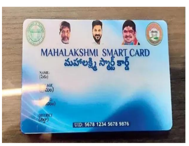
వివరించారు. ఇందుకు ఆమోదం తెలుపడంతో తొలుత జిల్లాకు ఒక మండలాన్ని పైలట్ ప్రాజెక్టుగా ఎంపిక చేసుకొని, సాంకేతిక సమస్యలు పరిష్కరించుకొని జారీ చేయాలని ప్రభుత్వం ఆదేశించింది. దీనిపై కనరత్తు జరుగుతోంది. స్మార్ట్ కార్డుకు సంబంధించిన విధివిధానాలు ఆర్టీసీ వరంగల్ రీజియన్ పరిధిలోని అధికారులకు ఇంకా అందలేదు. త్వరలో అందే అవకాశం ఉన్నట్లు చెబుతున్నారు. ఏటీఎం తరహాలో చిప్ తో కూడిన స్మార్ట్ కార్డు జారీ చేస్తారు. ముందుగా ఆధార్ కార్డు, ఒక ఫోటో సేకరించి మహాలక్ష్మిలకు ప్రాధాన్యత కల్పించడం చిప్ తో అనుసంధానిస్తారు. ఈ స్మార్ట్ కార్డుల్లో లభిదారుడి పూర్తి వివరాలు, ఫోటో, క్యూఆర్ కోడ్ ఉంటాయి.