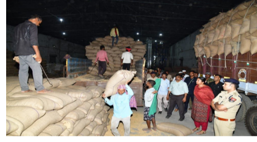
వేములవాడ రూరల్, బోయినపల్లి, మే - నేటి ప్రభాత దర్శిని ప్రతినిధి కలెక్టర్ నుంచి సేకరించిన ధాన్యం ఎప్పటికప్పుడు మిల్లులు.